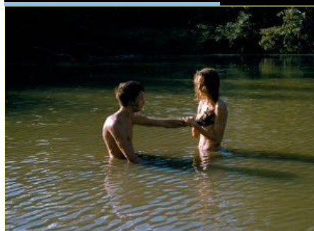
Una scena de "I Tempi Felici verranno Presto"

Ultime ore di attesa a Bosco Chiesanuova prima di conoscere i nomi dei vincitori della ventitreesima edizione del Film Festival della Lessinia . La cerimonia di premiazione è prevista per domani, sabato 26 agosto, alle 18 al Teatro Vittoria di Bosco Chiesanuova (Verona). Tra le 21 opere cinematografiche in Concorso quest'anno alla rassegna cinematografica internazionale, la giuria internazionale – composta da Camille Chaumereuil, Petra Felber, Frode Fimland, Andreas Pichler e Sara Zanatta – ha selezionato i vincitori dei premi Lessinia d'Oro (al miglior film in assoluto) e Lessinia d'Argento (alla migliore regia) . Altri riconoscimenti sono assegnati dal Curatorium Cimbricum Veronese al miglior film di regista giovane e